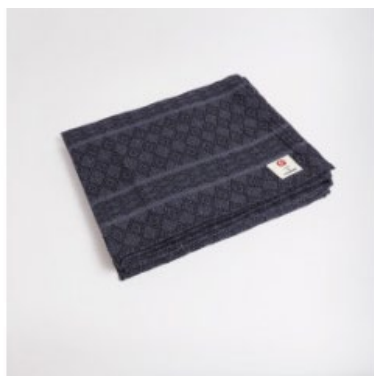
● couverture en coton - thunder