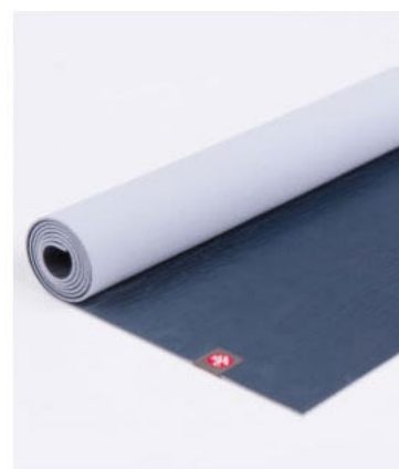
tapis de yoga eko® lite 4mm - midnight