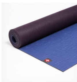
tapis de yoga eko® 5 mm - haze