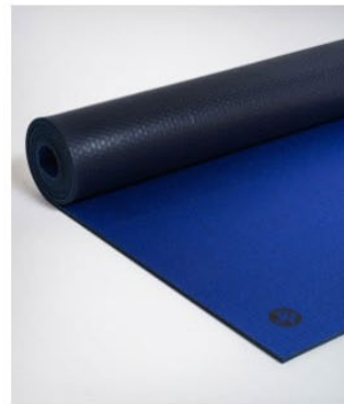
● tapis de yoga manduka pro® - forever (modèle spécial 120€)