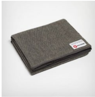
● couverture en laine recyclée - sediment