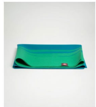
● tapis de voyage eko superlite™ - cayo