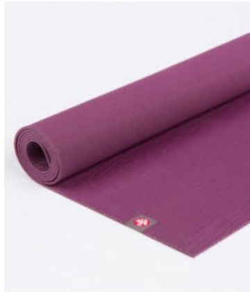
● tapis de yoga eko® lite 4mm - acai