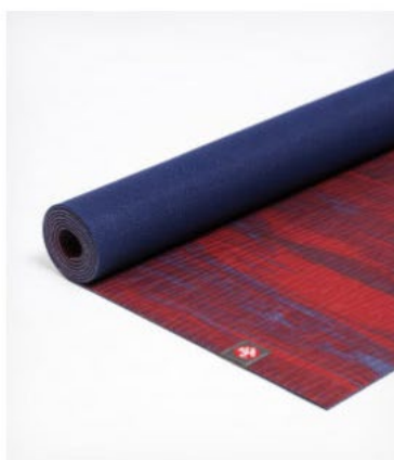
tapis de yoga eko® lite 4mm - resound