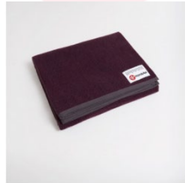
● couverture en laine recyclée - indulge