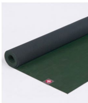
tapis de yoga eko® lite 4mm - sage