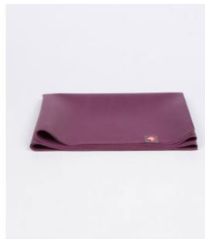
● tapis de yoga eko® superlite - acai