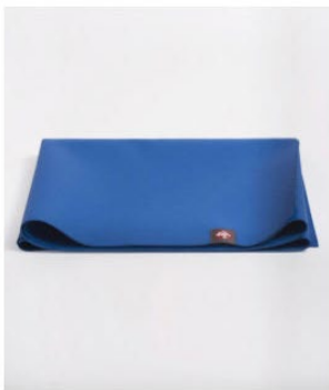
● tapis de yoga eko® superlite - truth blue