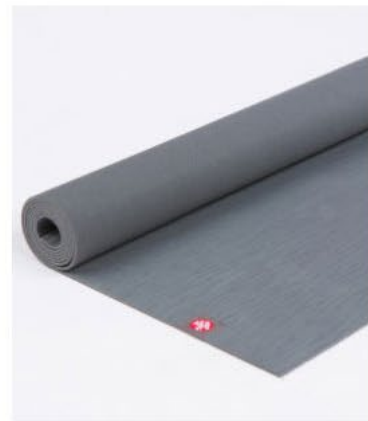
● tapis de yoga eko® lite 3mm - thunder