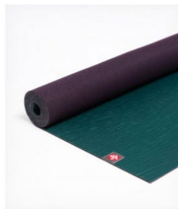
tapis de yoga eko® lite 4mm - thrive