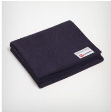
● couverture en laine recyclée - odyssey