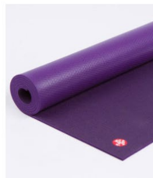
● tapis de yoga manduka pro® - black magic