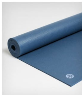
● tapis de yoga manduka pro® - odyssey