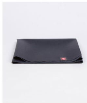
● tapis de voyage eko® superlite - midnight