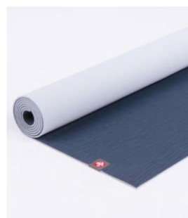
tapis de yoga eko® 5 mm - midnight