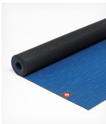
tapis de yoga eko® lite 4mm - truth blue