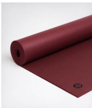
● ● tapis de yoga manduka pro® - verve