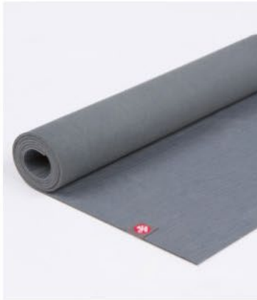
● tapis de yoga eko® lite 4mm - thunder