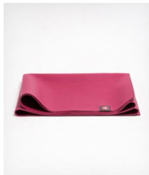
● tapis de yoga eko® superlite - fuschia