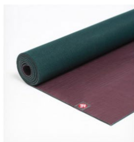
tapis de yoga eko® 5 mm - port