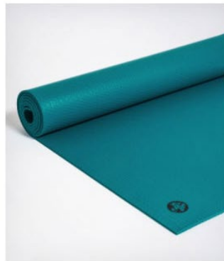
● tapis de yoga manduka pro® - harbour