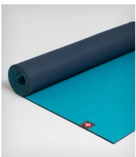
tapis de yoga eko® 5 mm - verdadero