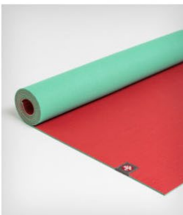
● tapis de yoga eko lite™ 4 mm - hermosa