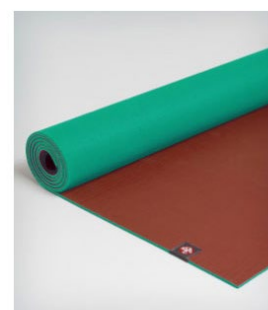
tapis de yoga eko® 5 mm - brick