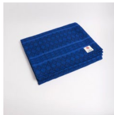
● couverture en coton - new moon

Bhakti - Nicolas Deru - rue des cerisiers 72, 4053 Embourg - info@bhakti.be www.bhakti.be - Tva : BE0667495404 - Iban BE58.6110.3229.2279