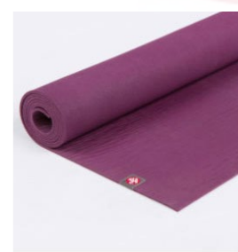
tapis de yoga eko® 5 mm - acai