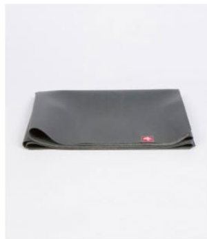
● tapis de voyage eko® superlite - thunder