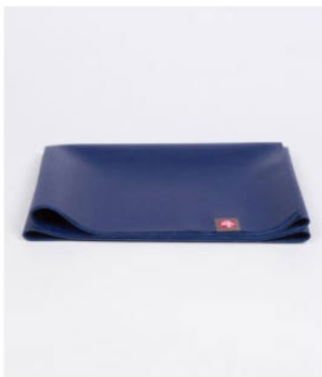
● tapis de voyage eko® superlite - new moon