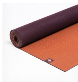
tapis de yoga eko® 5 mm - scotch