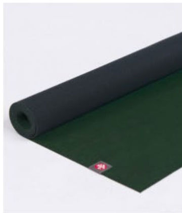
● tapis de yoga eko® lite 3mm - sage