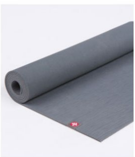
tapis de yoga eko® 5 mm - thunder