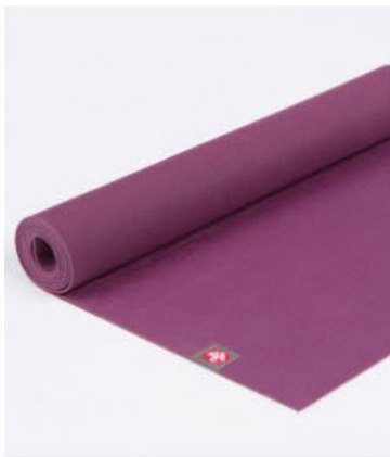
● tapis de yoga eko® lite 3mm - acai