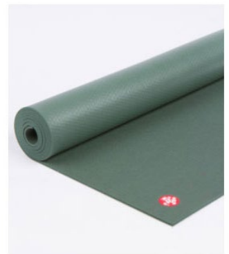
● tapis de yoga manduka pro® - black sage