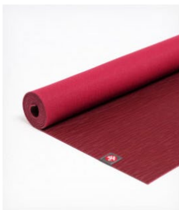
tapis de yoga eko® lite 4mm - verve