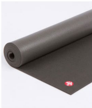
● tapis black pro®

Prix : taille standart = 99€ / taille extra long = 114€